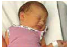
Ses mouvements sont plus vifs