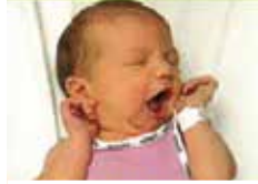
Il ouvre sa bouche