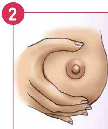
Rapprocher les doigts