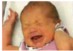
Sa peau rougit