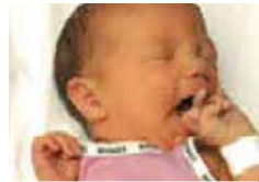
Il met la main en bouche