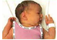
Il tourne sa tête (cherche)