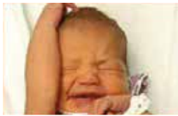
Il est agité